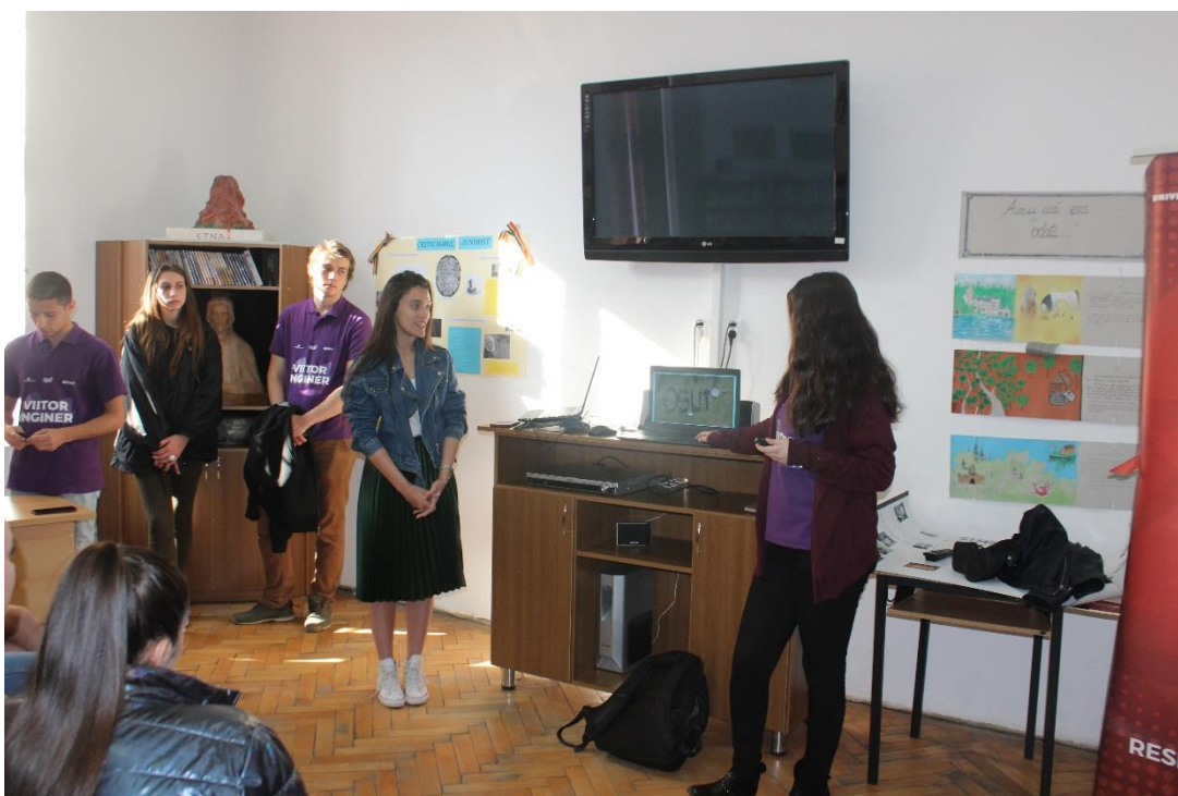
Diriginți, elevi din clasele a XI-a I și F